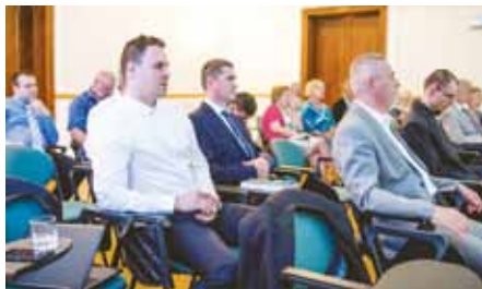
POHĽAD NA ÚČASTNÍKOV KONFERENCIE PARADIGMY BUDÚCICH ZMIEN V 21. STOROČÍ

Na začiatok júna pripravil Ekonomický ústav SAV aj medzinárodný vedecký seminár Vybrané riziká vývoja svetovej ekonomiky . Ako odznelo v prezentáciách, situácia svetovej ekonomiky prechádza komplikovaným vývojom, rastú riziká nedôvery a hrozby recesie. Odborníci varujú pred čoraz vyšším zadlžovaním sa štátov. Medzinárodný vedecký seminár nastolil a pomenoval problémové aspekty vývoja spoločnosti, jej ekonomiky, politiky a miesta a postavenia človeka miléniovej generácie nielen na trhu práce, ale predovšetkým v perspektíve vývoja spoločnosti.