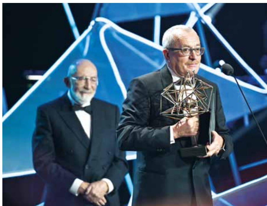
PO PREVZATÍ OCENENIA. V POZADÍ PREDSEDA MEDZINÁRODNEJ POROTA KIP THORNE, LAUREÁT NOBELOVEJ CENY ZA FYZIKU.

Som rád, keď sú v našej divízii kolegovia s rôznymi špecializáciami. Najviac máme metalurgov. Ale aj dosť vedcov, ktorí skončili fyziku pevných látok. I chemikov. Podľa našich skúseností vie taký „zmiešaný“ kolektív najlepšie riešiť problémy. Chýbajú nám ešte ľudia na matematické modelovanie. Ak mám hovoriť za seba, môžem povedať, že už nie som čistý fyzik. Asi už viac materiálový inžinier. No a v poslednom čase asi najmä manažér vedy.