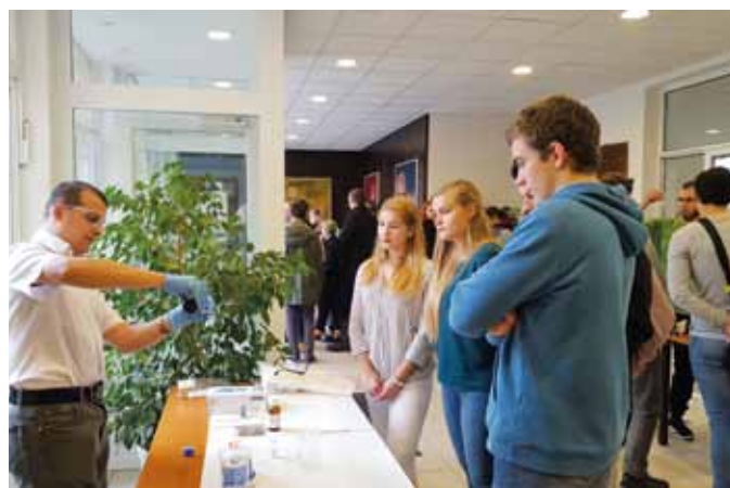
NA ILUSTRÁČNÝCH FOTOGRAFIÁCH AKCIE TÝŽDŇA VEDY A TECHNIKY V MINULÝCH „NEPANDEMICKÝCH“ ROKOCH.