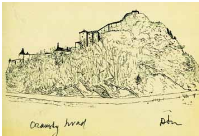
VLASTNORUČNÁ SKICA ORAVSKÉHO HRADNÉHO BRALA